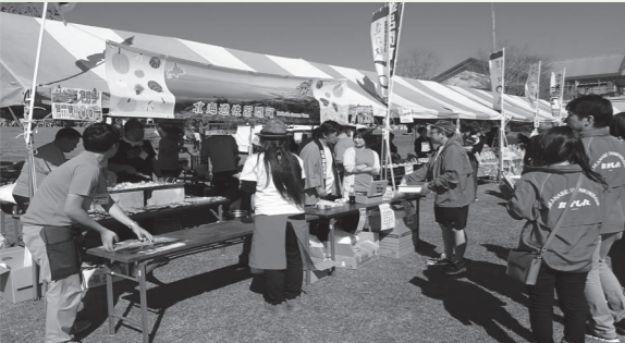
両町の交流進展に期待（昨年の都農産業まつりの様子）

■オホーツクサイクリングの終了 昭和57年に始まった、雄武町から佐呂間町を通過して斜里町までのオホーツク沿岸、最長200キロ余りを自転車で行き抜ける「インターナショナルオホーツクサイクリング」は2月25日に開催された実行