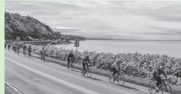
今年が最後の大会となるオホーツクサイクリング

■オホーツクサイクリングの終了 昭和57年に始まった、雄武町から佐呂間町を通過して斜里町までのオホーツク沿岸、最長200キロ余りを自転車で行き抜ける「インターナショナルオホーツクサイクリング」は2月25日に開催された実行