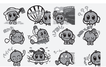
ご存知でしたか、モモちゃんLINE スタンプ

経済課長 直近の件数は把握していませんが、今年の春の段階では700件程度となっています。