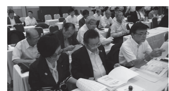
今後も読みやすい広報誌の作成に努力します

■10月31日(木) 道内行政調査(浦幌町) 8月26日、根室管内別海町議会の産業建設常任委員ら7名が来町し、別海町での養殖漁業振興の参考とするため、佐呂間漁業協同組合を訪れ、サロマ湖におけるカキやホタテの養殖について学ぶとともに、ホタテの加工施設を視察されました。