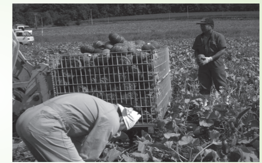
ひとつずつ手作業で行われるカボチャの収穫

■農業について 農作物の生育は平年より進み、秋まき小麦の収穫作業は8月1日に終了し、作付面積640ヘクタールのうち2ヘクタールは「小麦なまぐさ黒穂病」により収穫前に廃耕としましたが、平年を上回る結果となりました。 カボチャの収量は平年並みを見込めるとの報告を受けており、ビートは生育が順調で増収が見込まれております。牧草の1番草収穫は平年並みでしたが、2番草は成長期の高温・少雨の影響で生育が停滞し減収となり、デントコーンは、平年並みの収量見込みであります。 酪農の受託乳量は、大規模農業法人で搾乳牛の増頭が進んだことにより、生乳生産が伸びているとの報告を受けております。 また、個体販売につきまし