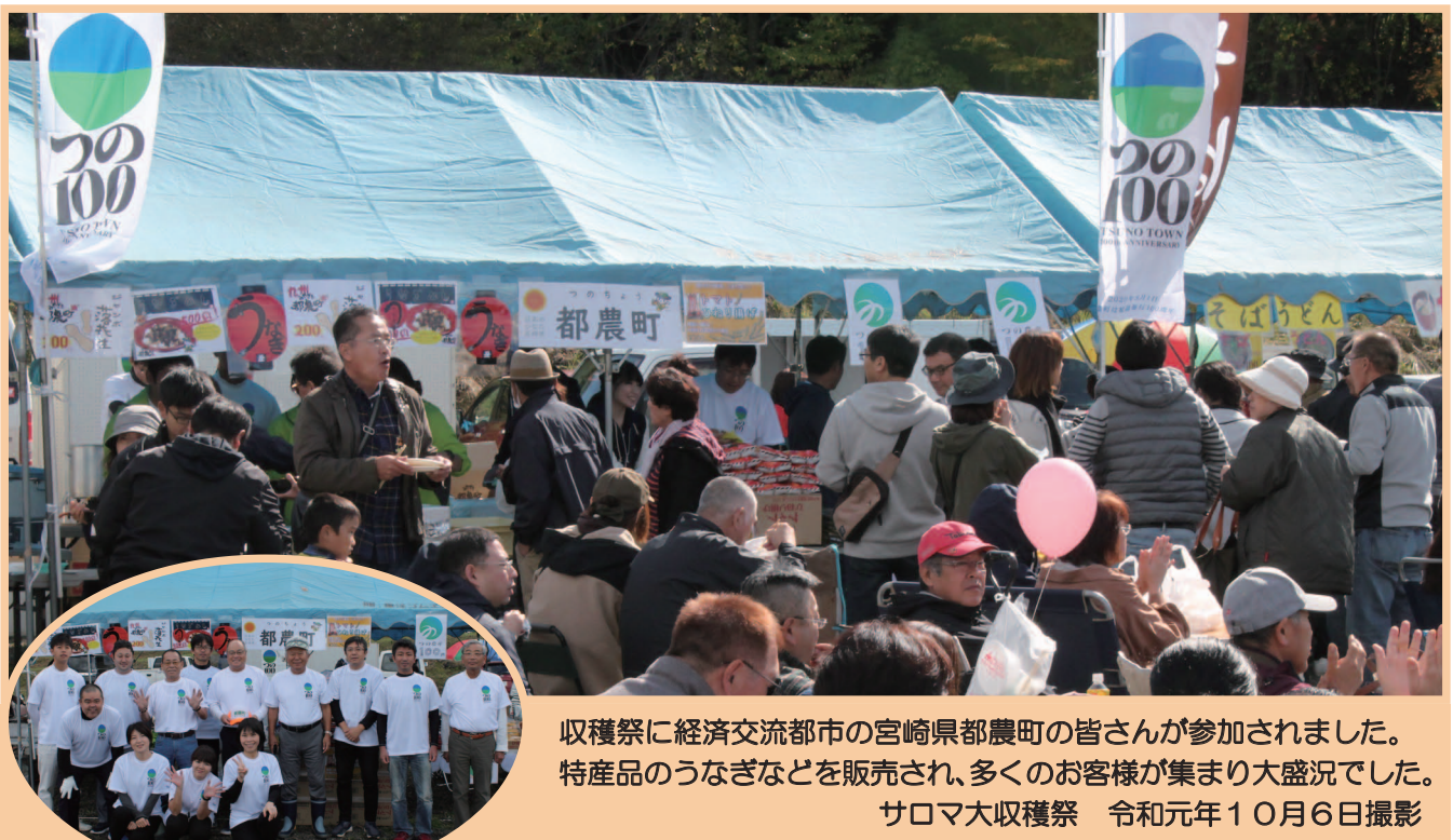
収穫祭に経済交流都市の宮崎県都農町の皆さんが参加されました。特産品のうなぎなどを販売され、多くのお客様が集まり大盛況でした。サロマ大収穫祭 令和元年10月6日撮影