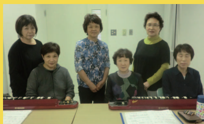
練習後のお茶飲みタイムも楽しいひとときです。