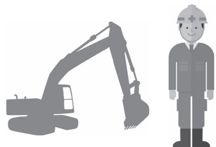
大型免許取得者の確保が急務となっています

防災行政無線の整備 2億9810万円 防災行政無線を現在のアナログ方式からデジタル方式へ変更する工事と合わせて、災害時に町民へ正しい情報を伝達し、安全な避難誘導などを行えるようにするため、町内各家庭へ防災行政無線の個別受信機を設置します。 ◎事業内容 ・親局 1局 ・基地局 2局 ・移動系無線 30台 ・屋外拡声子局 3局 ・個別受信機 2500台