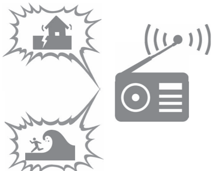
災害発生時に避難情報が受信機に届けられます

町内の各家庭に個別受信機を設置する 防災行政無線整備事業を実施 一般会計は前年度比5.7% 2億8343万円の増額