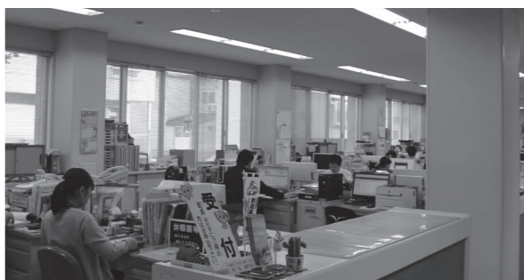
庁舎は電力会社の見直しやLED化により節電に努めています