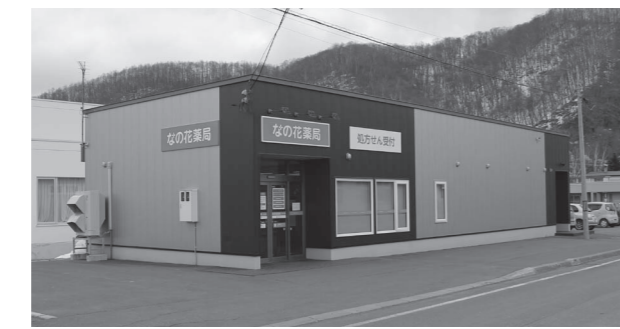
利用者の視点に立った薬局の利便性の向上が求められています

副町長 患者がクリニックさるまに行かなくても薬の処方箋を出してもらえないかということですが、今新型コロナウイルス対策として、特別な場合はそのような対応を取るようにとの通知が国から来ています。 ただしこれはあくまでも例外であり、どうしても必要な方はまずクリニックさるまへ電話をしていただき、その方がこの対策に該当するのかわ