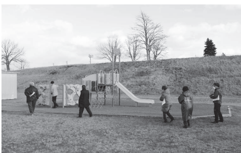
新設された複合遊具を視察

長い間、地域の子ども達に利用されてきた遊具でしたが経年劣化が著しく、何より安全安心な公園管理が重要であるため、引き続き計画的な公園整備を進めていただきたいと思います。