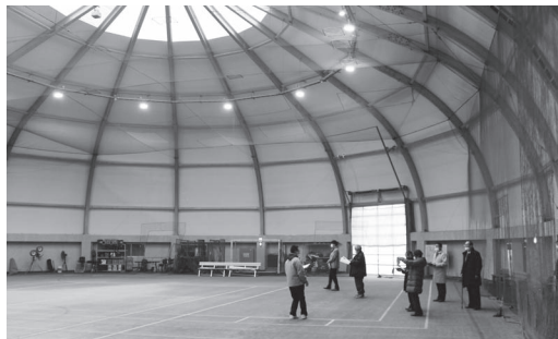
特に球技活動を行うには助かる明るさに

以前より利用者から、屋内照明が暗いと申し出があったことからLEDに取り替え、非常に明るい環境下で日中や夜間のスポーツ活動ができるようになりました。