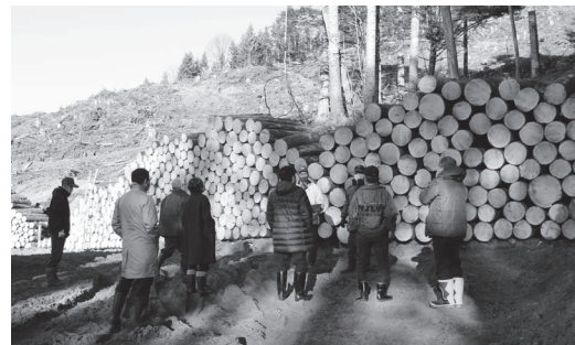
材積約800㎡のトドマツ