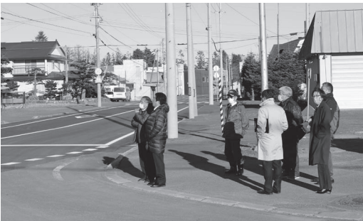
工事1年目を終えた浜佐呂間市街道路

また、サロマ湖100kmウルトラマラソン大会50kmの部との合流地点となる道路であり、段差等があつては危険なため令和4年度より2ヶ年計画で工事が行われる予定であり、今年度は延長530mのうち300mが施工されました。