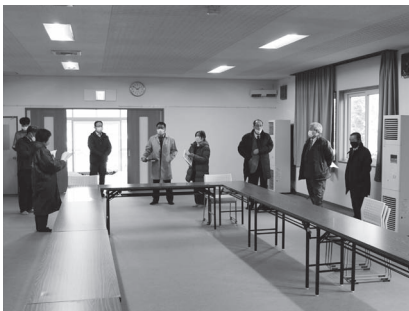
仁倉公民館内の更新箇所を視察

同補助制度を活用し、老朽化した屋根塗装、館内の床改修、冷暖房機、照明器具及び音響設備が更新されました。