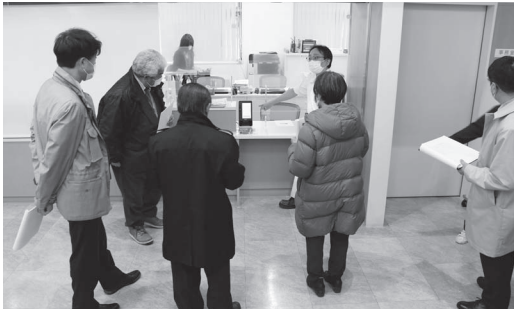
新たに導入した機器の説明

また、会計窓口には自動精算機が設置されるなど、今後とも時代のニーズに合わせた利便性の高い診療所運営に努めていただきたいと思います。