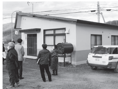
塗装工事された東公民館