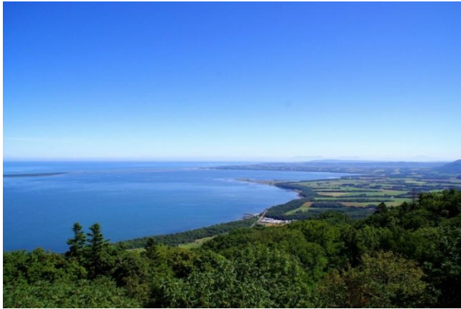
サロマ湖展望台からの風景