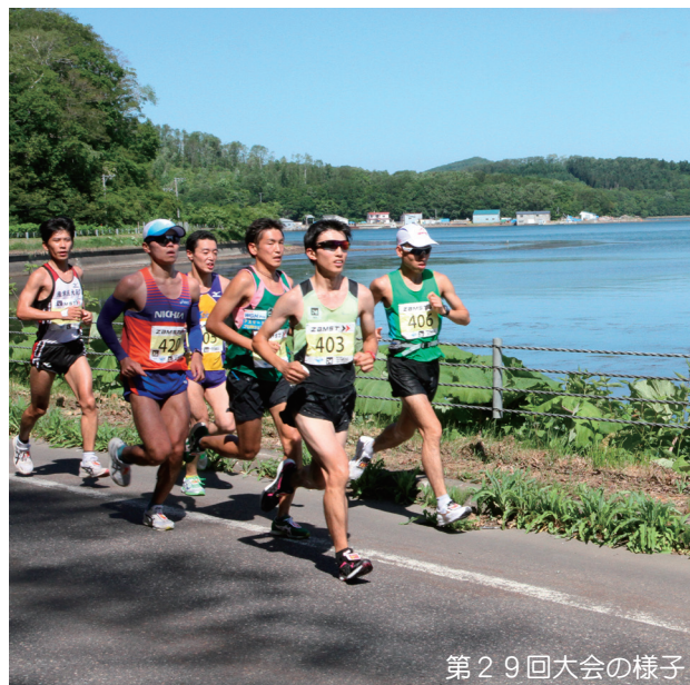
第 29 回大会の様子