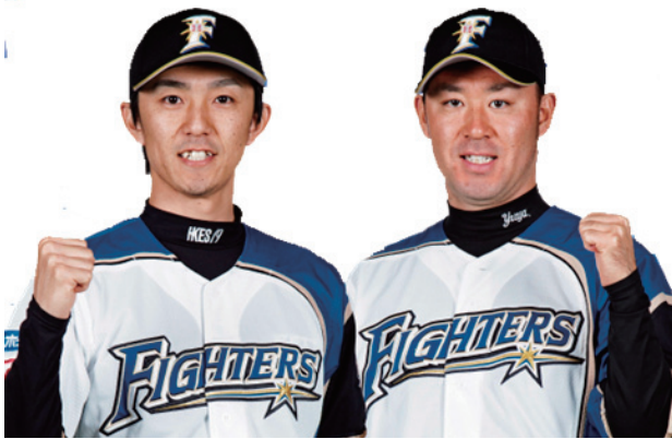
2015年 佐呂間町応援大使 増井 浩俊選手（左）、石井 裕也選手（右）

北海道教育庁のキャンペーン「グラブを本に持ち替えて」による北海道日本ハムファイターズの特別展示を、6月2日（火）から6月28日（日）まで、図書館会議室で開催します。ファイターズの選手たちのおすすめの本や、プロ野球に関する本を特集いたしますので、ぜひ来館ください。