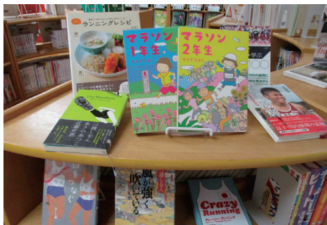
今月は「マラソン特集・他」

玄関入口近くでは、毎月変わる「特集コーナー」を設けています。パッと見て、ちょっと借りたくなる様な本を沢山そろえています。毎月の特集をお楽しみ下さい。