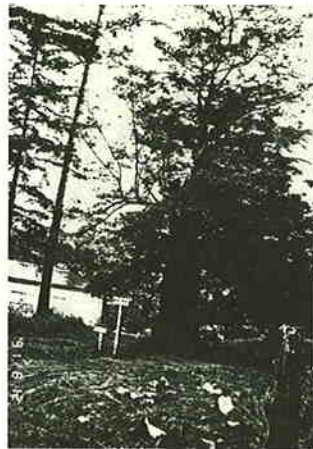
栃木神社男オンコ全像